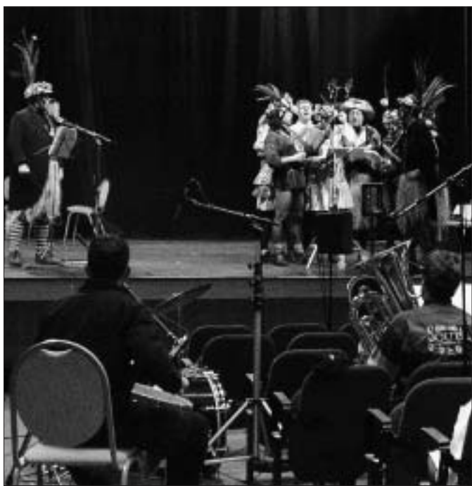
Après « Chez mon cousin », un fan-club, DDP, suit désormais les Prout dans l'aventure de l'Olympia et au-delà...