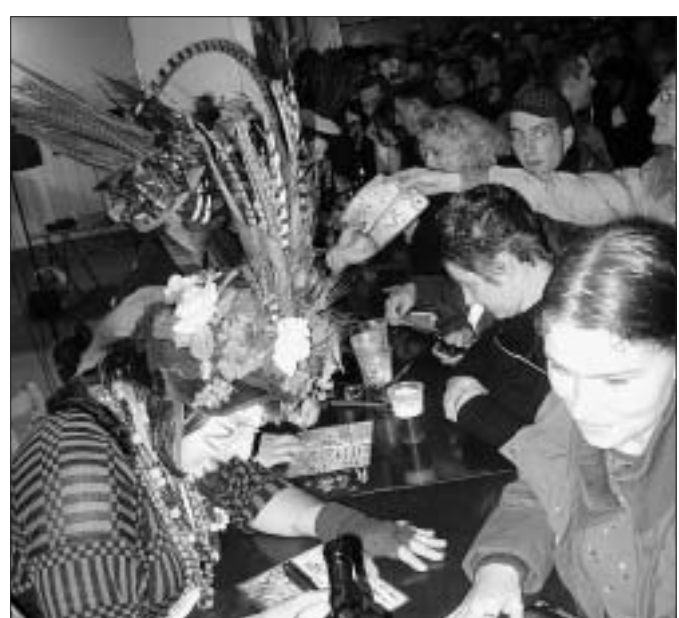
Dimanche, les Prout ont signé des autographes durant près de six heures. Tout en blaguant avec les Dunkerquois.