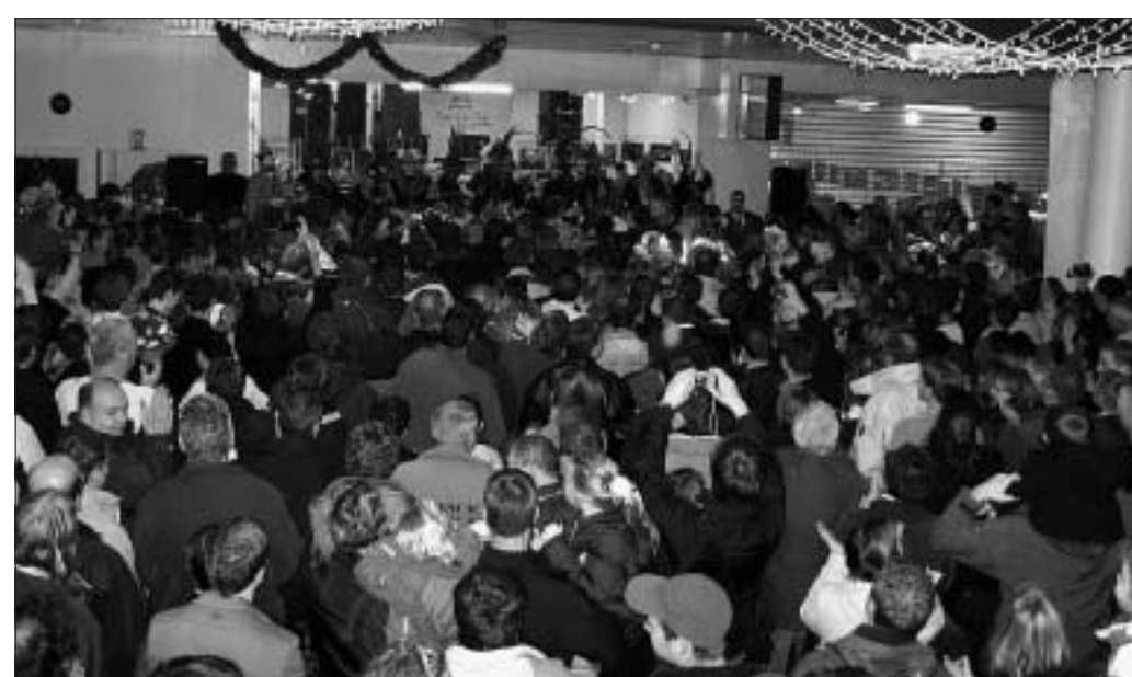
Les inconditionnels des Prout n'ont pas manqué le petit concert présenté par leurs idoles au Pôle Marine.