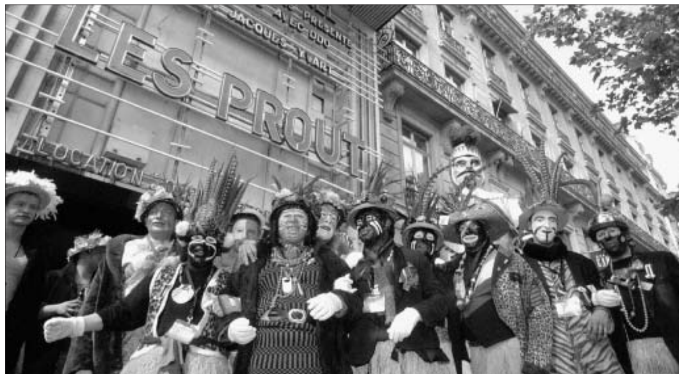
Sous les fameuses lettres rouges de la façade de l'Olympia, les Prout au grand complet ont posé comme des vedettes, au pied de Reuze Papa qui avait fait le déplacement.