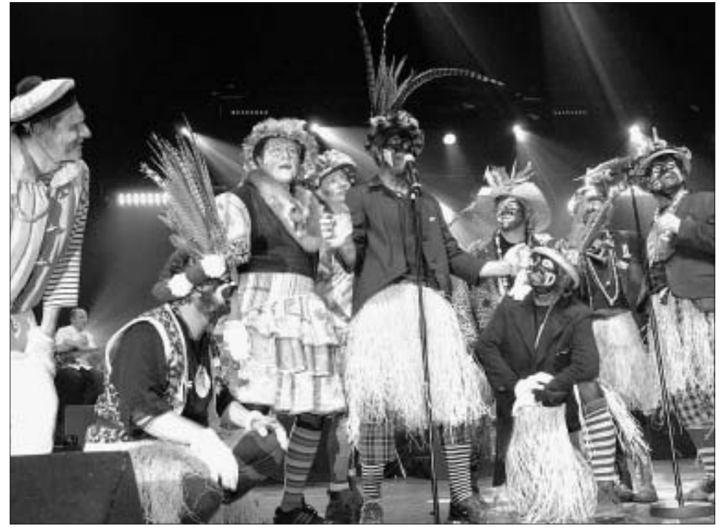
Ceux qui auront manqué ou envie de revoir le concert mythique des Prout pourront le réécouter ou le revoir grâce au coffret mis en vente par Orion Productions en décembre.