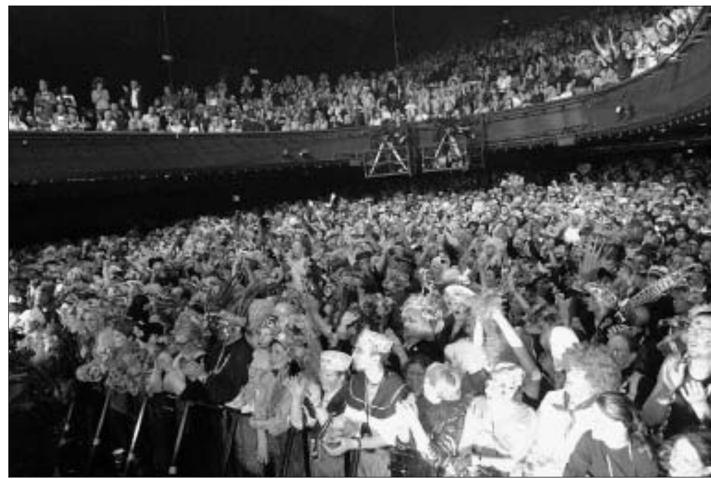
Durant deux heures et demie, la communion a été totale entre les 2 500 carnavaliers présents à l'Olympia et les dix Prout qui ont vécu dimanche une folle aventure.

à la guitare électrique repris en chœur par l'assemblée, un Quand la clique elle donne très rock'n'roll et une Grande Cappelle version électrique et « unplugged ». Deux heures et demie après le lancement de cette grande soirée carnavalesque, les Prout revenaient une ultime fois sur la scène, entourés de leurs musiciens, afin d'entonner une Cantate à Jean Bart , en communion avec leur public. À genoux, célébrant le plus renommé des leurs dans la plus mythique des salles parisiennes, les Dunkerquois étaient bel et bien chez eux.