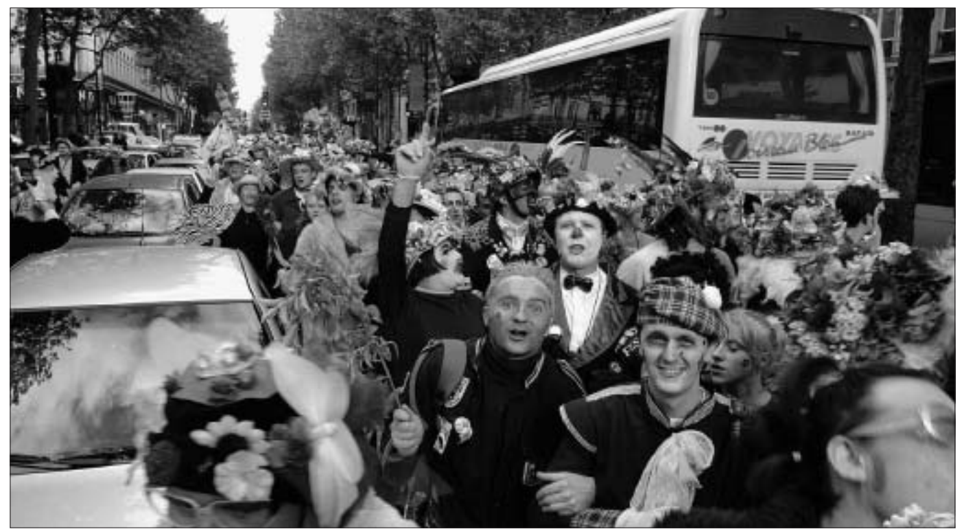
Les vagues de carnavaliers ont déferlé sur le boulevard des Capucines, face à l'Olympia, en un flot ininterrompu de cars. Au programme de cet après-midi parisien : cours de carnaval aux passants et de « tut-tut » aux automobilistes.